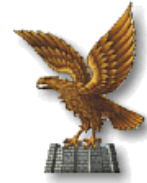
REGIONE AUTONOMA FRIULI - VENEZIA GIULIA